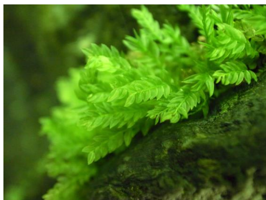
ナメリチョウチンゴケ

御岳ビジターセンターホームページ https://mitakevc.ces-net.jp/index.html