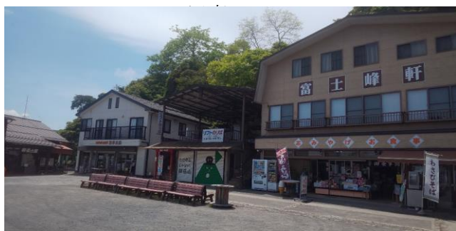
ケーブルカー御岳山駅前売店街

御岳山にはふらっと昼食、ティータイムをとることができる売店・食堂があります。晴れていると行列もできるお店も、雨の日は御岳山へ訪れるお客様も少ないことからゆっくりお食事をとることができます。また普段忙しくお客様の接待をされているスタッフの方とお話することができ、御岳山に住む方だけが知っているお話を聞くことができるかもしれません。