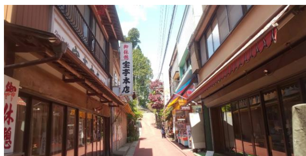
武蔵御嶽神社参道商店街