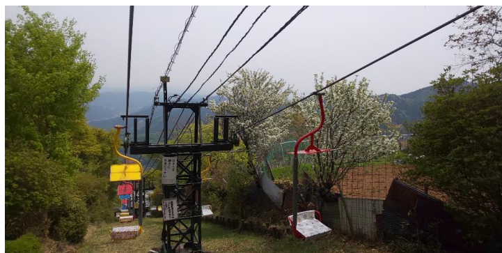
1 人乗り観光リフトは小型犬を抱っこして一緒に乗ることができます