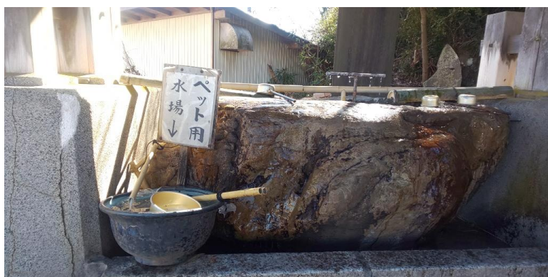
手水舎にはペット用の用意もあります