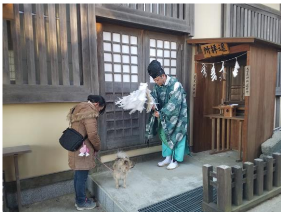
武蔵御嶽神社 愛犬祈願の様子