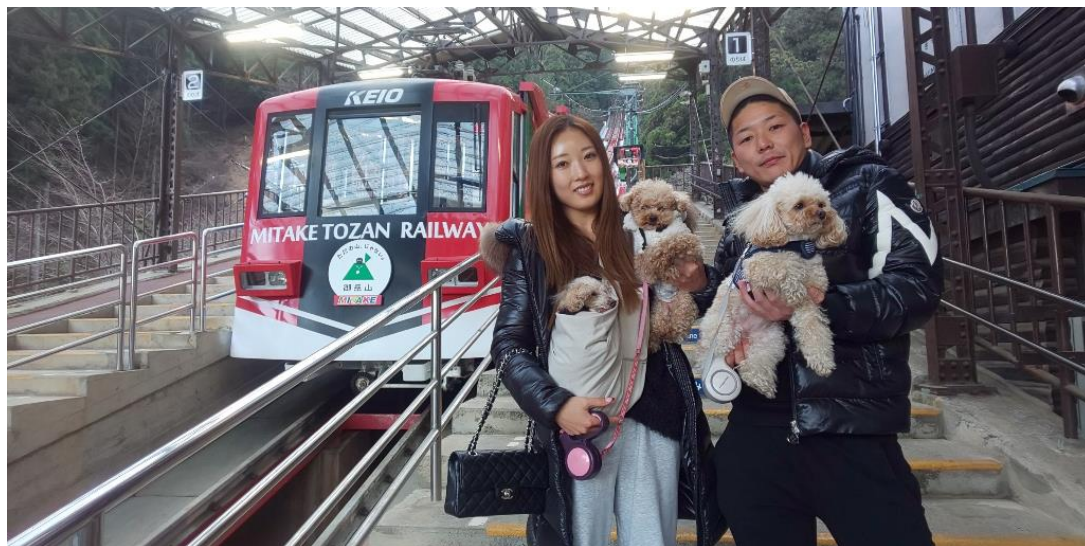
2026年1月17日千葉県からお越しいただいたチョコちゃん・チーちゃん・プーちゃん

このニュースについてのお問い合わせは、御岳登山鉄道株式会社 【☎ 0428 - 78 - 8123 山本】までお願い致します。