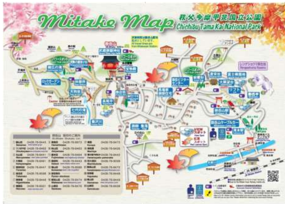
Mitake Map (表面)