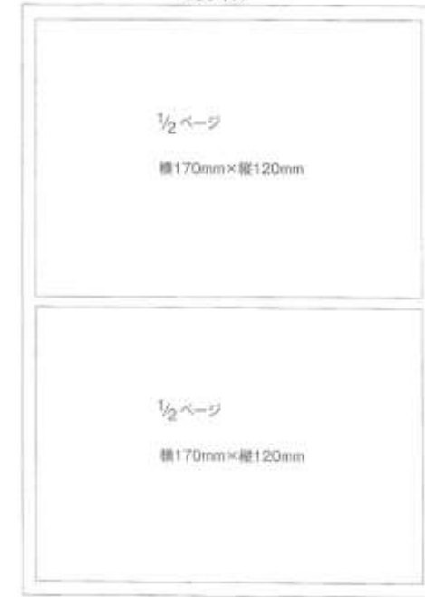
パンフレット広告スペース（裏表紙）