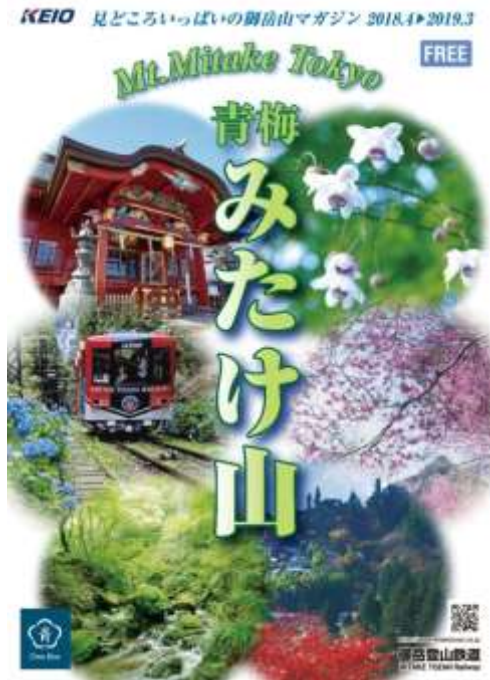
パンフレット（表紙）