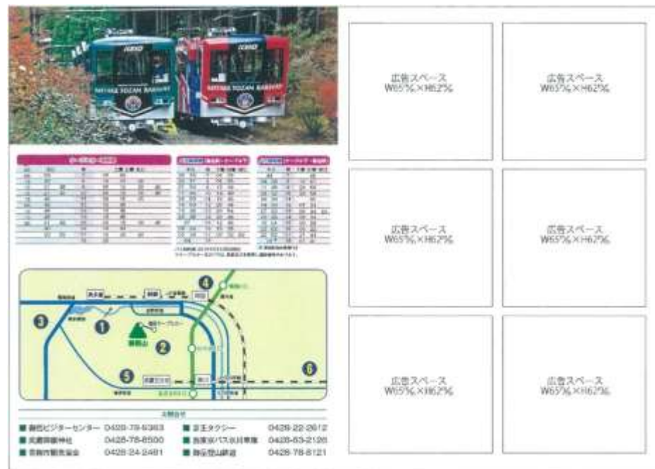
Mitake Map 広告スペース (裏面)